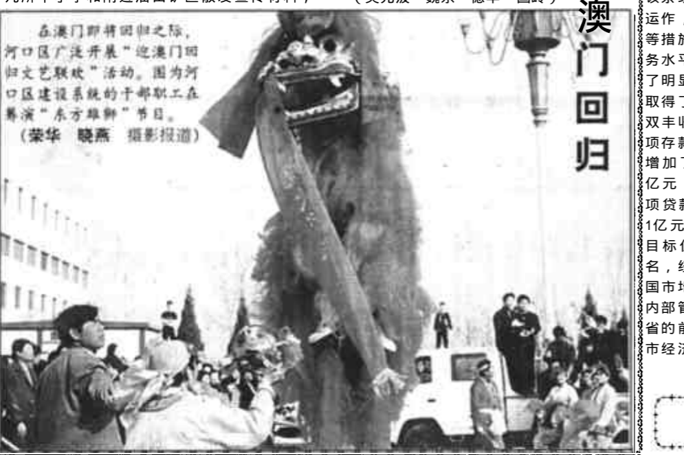
在澳门即将回归之际,河口区广泛开展了“迎澳门回归”文艺联欢活动。图为河口区建设系统的干部职工在表演“东方明珠”节目。

了,到底澳门是什么情况我还真不清楚,我得好好看这份材料。”利津镇崔林村的戴着眼镜,名叫曹振东的中年男子拿到材料后看了几行,就立在那里高声读了起来。看到周围的群众热情高涨,王君激动地拿起话筒喊了起来:“再有16天澳门就要回归祖国了,希望大家多了解澳门,都做澳门回归的宣传员。我再向大家介绍一下澳门……” (吴允波 魏东 德华 国岭)